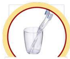
ТУАЛЕТНЫЕ ПРИНАДЛЕЖНОСТИ (ЗУБНЫЕ ЩЕТКИ, РАСЧЕСКИ И ПР.)