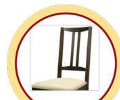
СПИНКИ СТУЛЬЕВ, НЕ ОБИТЫЕ ТКАНЬЮ И МЯГКИМ ПОРИСТЫМ МАТЕРИАЛОМ