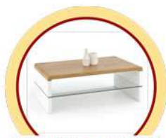
ЖУРНАЛЬНЫЕ СТОЛИКИ И ПРОЧИЕ ЖЕСТКИЕ ПОВЕРХНОСТИ