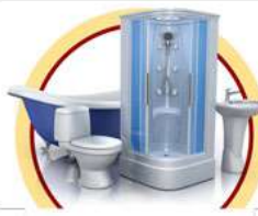
ТУАЛЕТ (УНИТАЗ, ВАННА, ДУШЕВАЯ КАБИНА, БИДЕ)